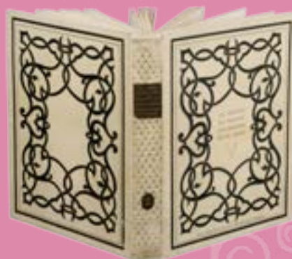
Reproduction de l'ouvrage Les Richesses des bibliothèques provinciales de France de Pol Neveux, éditions des Bibliothèques nationales de France, 1932

les documents peuvent être photographiés pour un usage privé mais, par souci de conservation, les photocopies ne sont pas autorisées. Si vous devez diffuser ces reproductions dans le cadre d'un travail universitaire ou d'une publication, veuillez contacter au préalable la responsable du fonds.