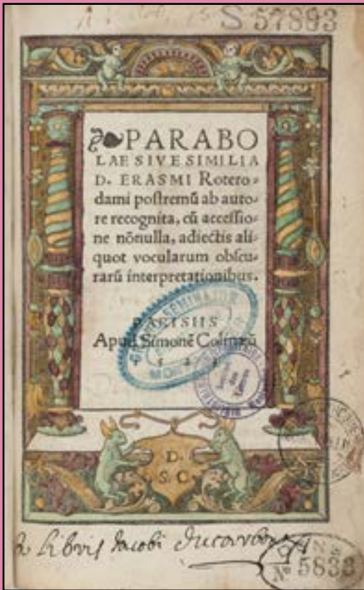
Image extraite du livre d'Érasme, Parabolae sive Similia D. Erasmi Roterodami postremum ab autore recognita, cujus accessione nonnulla, adiectis aliquot vocularum obscurarum interpretationibus , Paris, 1523