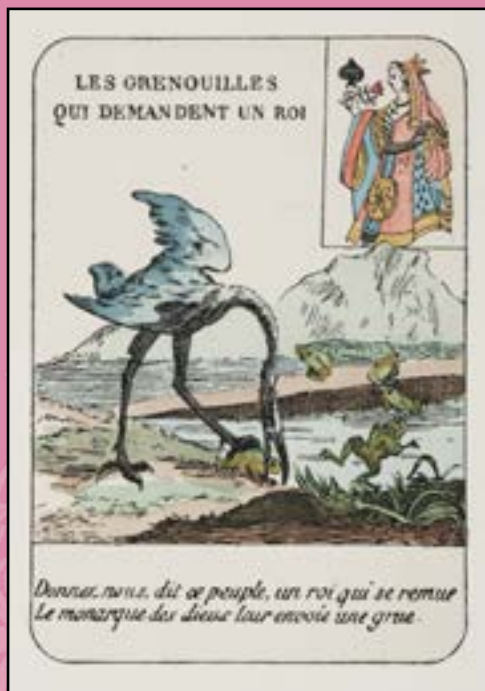
Extrait de Les Cartes à jouer du xiv e au xx e siècle d'Henry-René d'Allemagne, 1906