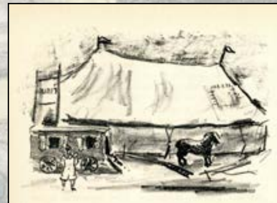
« Scène de cirque » (lithographie) par Edmond Heuzé dans Le Chapiteau de mes amours , 1949